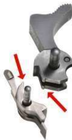
Evidenziati i piani di scatto su cane e controcanne

I congegni di scatto e percussione si avvalgono di molle a spirale o a lamina che forniscono a una "massa battente" (il cane o lo stesso percussore) l'energia necessaria al "percussore", elemento che trasferisce l'urto della massa battente alla capsula della cartuccia. È presente un "arpionismo" che fissa la molla e il cane in posizione di armamento. Sono presenti inoltre un "dente di arresto" ricavato sulla massa battente e un dente di scatto (i piani di scatto). Il grilletto o leva di scatto di un'arma da fuoco, mette in contatto la leva stessa con il meccanismo di percussione facendolo funzionare in vari modi.