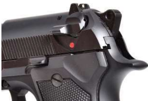
Pistola Beretta serie 92. Si nota la sicura manuale che, oltre ad interrompere la catena di scatto, ha la funzione "abbatticane"

Le sicure manuali si inseriscono tramite leve ergonomiche applicate sulla struttura dell'arma. Quando attivate agiscono sui meccanismi interni in vari modi. Possono interrompere la catena di scatto e/o, in particolari modelli, evitare di azionare manualmente il cane tramite la sicura detta " abbatticane ". Tale congegno provvede a sottrarre il percussore all'azione del cane mentre questo torna in posizione di riposo in piena sicurezza.