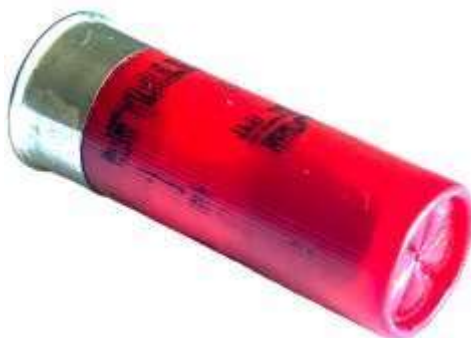
Cartuccia calibro 12. Anteriormente si

In questo caso il calibro indica il numero di palle - di eguale peso - che si possono ricavare da una libbra inglese (gr. 453,6) di piombo. Quindi, un fucile da caccia cal 12, (12 palle) ha un calibro in millimetri più grande del calibro 20 (20 palle).