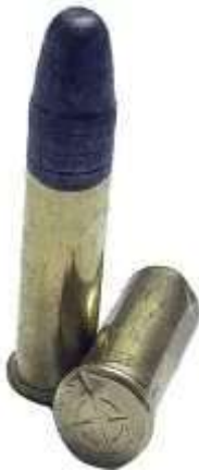
Cartucce calibro .22LR, notare l'impronta del percussore sul bordo del fondello

Al momento dell'esplosione si raggiungono temperature che variano tra i 1500 e i 2200 gradi centigradi.