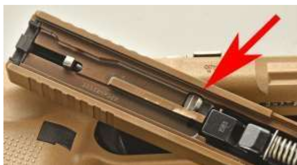
La freccia indica la provvidenziale sicura automatica al percussore collocata all'interno del carrello

Le sicure automatiche sono, invece, quelle sempre attive. Esse si disattivano solo al momento dello sparo volontario dell'utilizzatore.