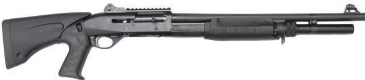
Un moderno fucile semiautomatico calibro 12 in configurazione tattica

In ultimo i fucili semiautomatici , che impiegano vari sistemi di funzionamento. I modelli più diffusi si avvalgono di otturatori a testine rotanti, sistemi a recupero di gas e principi inerziali.