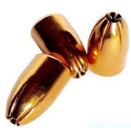
Palle Hexagon calibro 9mm

Prendiamo a esempio il calibro 9mm che forse tutti hanno sentito citare. Se entraste in un'armeria chiedendo di acquistare delle cartucce calibro 9mm, l'armiere resterebbe interdetto e vi chiederebbe di essere più precisi. Perché infatti il calibro da solo non basta a indicare il tipo di cartuccia.