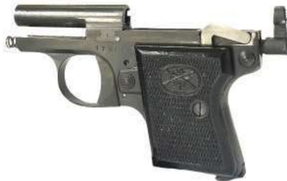
La pistola Bernardelli, mod. Baby, dotata di chiusura a massa in smontaggio ordinario. Si nota la canna ancorata al fusto

Chi non è dotato di una discreta forza nelle