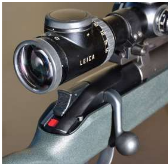
Una carabina dotata di pulsante disarmo del percussore. Un vistoso elemento rosso avvisa che il percussore è armato

Di seguito alcuni " concetti di sicurezza " che riguardano sia la gittata delle cartucce a palla, sia la particolare meccanica delle armi lunghe impiegate in ambito venatorio.