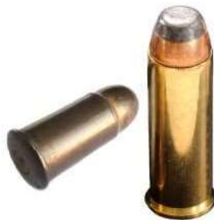
Una cartuccia 10,4mm Ordinanza Italiana e in piedi una .44 Remington Magnum

Da notare poi che un'identica cartuccia può prendere vari nomi in base al paese che l'adotta. Il noto calibro 9x19, è denominato anche: 9 Luger , 9 Parabellum , 9 lungo Beretta M38 , 9 lungo , 9 M38 , 9 mm Pistolen-Patrone 08 , 9 mm Pistolen-Patrone 400(b) , 9 mm Pistolen-Patrone M 1941 , 9 mm Suomi , 9 mm Swedish m/34 e m/39 , 9 mm 40 M Parabellum .