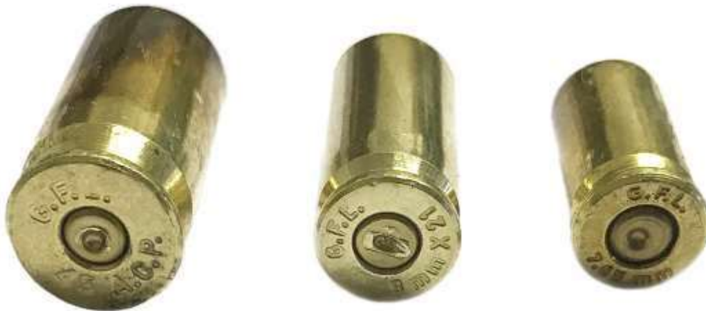
Foto di alcuni bossoli sparati che recano sulla capsula l'impronta del percussore. Si nota nel fondello l'indicazione del calibro e della fabbrica

Inizialmente, per la carica di lancio si utilizzava la cosiddetta "polvere nera", una miscela ternaria di carbone, zolfo e salnitro. Non priva di difetti, la polvere nera a fine anni 800 fu gradualmente sostituita dalla polvere da sparo moderna, detta "infume" a causa del minor fumo che genera durante la combustione.