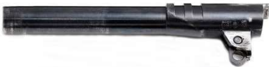
La canna di una pistola Colt mod 1911, dotata di biella e tenoni

Il sistema di chiusura Colt/Browning a corto rinculo di canna si avvale, per il funzionamento, dei tenoni ricavati sulla canna in prossimità della camera di cartuccia. I tenoni combaciano con rispettivi incavi praticati sul cielo del carrello. La canna è provvista di uno zoccolo al quale è fulcrata una piccola biella, a sua volta trattenuta al fusto tramite il traversino della leva arresto carrello (hold open) .