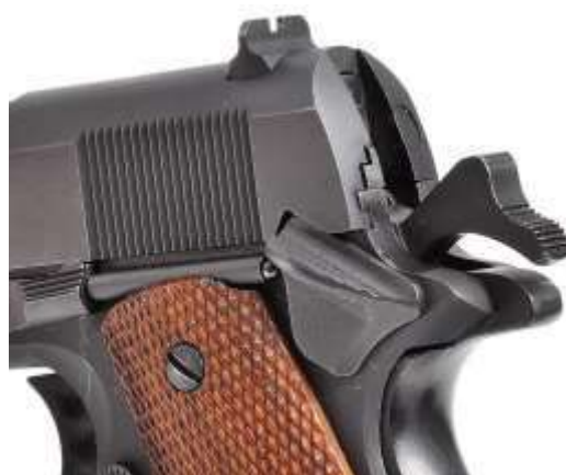
Una pistola Colt mod. 1911 con sicura inserita e cane armato. Il grilletto è bloccato, l'arma è "cocked and locked"