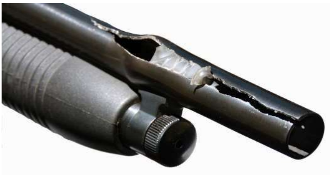
Fucile calibro 12. Il picco delle pressioni, dovuto a ostruzione, ha causato rigonfiamento e fessurazione della canna in prossimità della volata

Le alte pressioni, generate dalle moderne cartucce, non si adattano ad armi antiquate o mal conservate. Identica attenzione va riposta nel controllo dell'interno delle canne in quanto anche una lieve ostruzione (foglie, sporcizia, pezzuole utilizzate per pulizia) può provocare danni molto gravi, sia al tiratore, sia a persone a lui vicine.