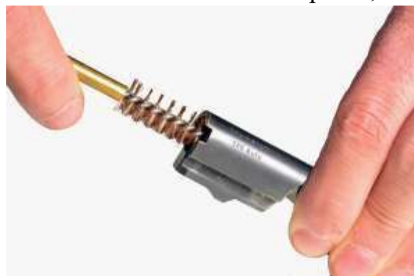
Lo scovolo dovrebbe essere inserito dalla camera di cartuccia

Nel caso i residui di piombo o rame depositati all'interno della canna fossero eccessivi, si potranno utilizzare appositi solventi ( copper e lead remover ). Dopo