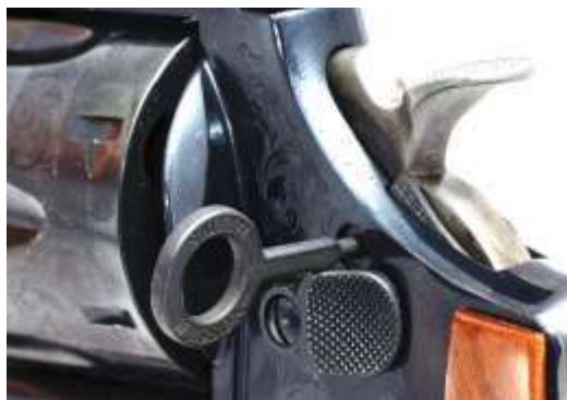
Sicura a chiave di un revolver

Sempre nell'ambito dei revolver, esistono anche particolari sicure manuali, che si attivano tramite piccole chiavi che impediscono l'utilizzo delle armi a persone non autorizzate.