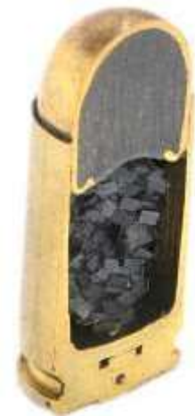
Una cartuccia metallica sezionata. Si nota all'interno la polvere da sparo e la palla blindata con il nucleo di piombo

La capsula, inserita nell'alloggiamento ricavato nel fondello del bossolo, è simile a